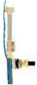
Pumppu on helppo nostaa ja laskea T-putken avulla

Vesijohto pumpusta taloon liitetään satulan avulla. Satula on rakennettu kahdesta sisäkkäin liukuvasta osasta. Liitoksen tiiviys on varmistettu O-renkaalla. Rakenteen ansiosta pumppu voidaan nostaa kaivosta irrottamatta putkiliitoksia. Saatulaan kiinnitetty T-putki (R25) toimii työkaluna asentaessa pumppu letkuineen kaivoon.