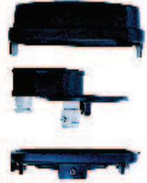
Kansi koostuu kolmesta osasta

EMS porakaivonkansi on käytännöllinen ja siisti tapa peittää porakaivon pää. Maan pinnalla näkyy ainoastaan siisti musta kansi. Kannessa on sähköasennuskotelo ja kiinnityskorva varmuusvaijeria varten. Kansi voidaan lukita. Kaivossa oleva pumppu voidaan nostaa kaivosta irrottamatta kannen runko-osaa.